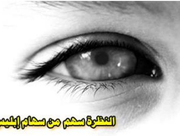
النظرة سهم من سهام إبليس

كما أَنَّ الاستمناء من المفطرات بل إذا أتى بشيء من الملاعبة ونحوها ولم يطمئن من نفسه بعدم خروج المني فاتفق خروجه بطل صومه فيجب القضاء وإذا كان عاملاً بالمفطرية فتجب الكفارة.